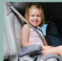
Booster sin respaldo

El Departamento de Salud del Condado de Clark tiene enfermeras certificados en seguridad del niño pasajero que lo harán: