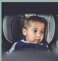
Orientación hacia adelante